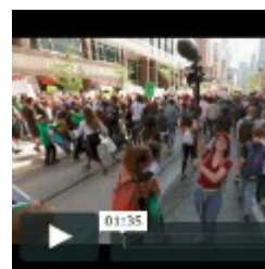
Trailer & Presseinfos

Alle Downloads: www.youthunstoppable.de/#download